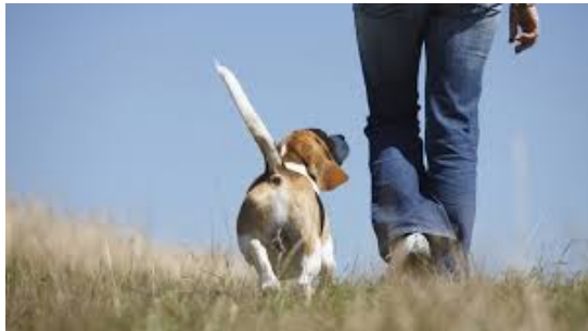
Führung durch Beziehung