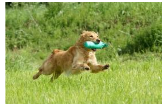
Teamwork mit Freude

Im LEITWOLF-TRAINING bekommt Teamwork zwischen Mensch und Hund eine besondere Bedeutung.