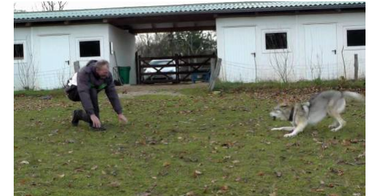
Körperaktives Spiel ohne Hilfsmittel

Das körperaktive Spiel ohne Hilfsmittel steht deshalb ganz oben auf der Liste des LEITWOLF-TRAININGS .