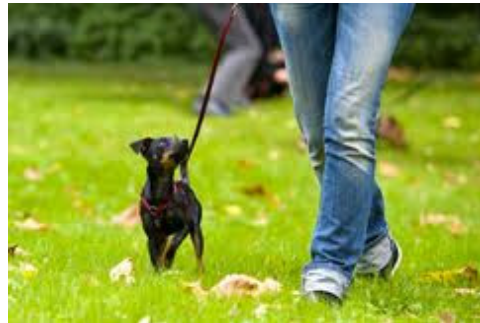
Führung durch Beziehung

Hunde wollen in einer Gruppe leben die zusammenhält. Diese Gruppe braucht eine Leitfigur.